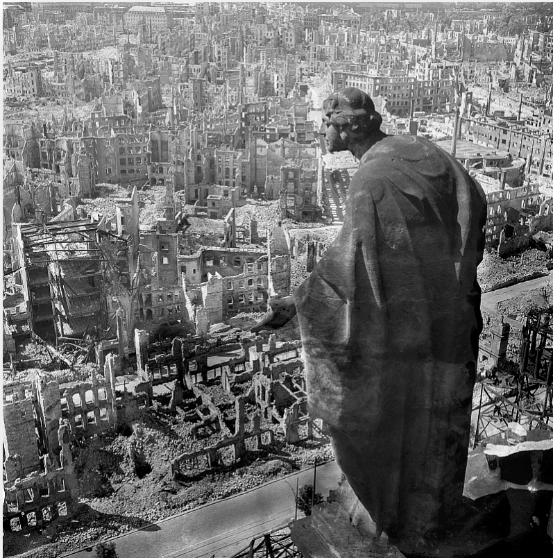
Primary Source: Photograph

戦争の勃発以来、スターリンは本土でヒトラーと戦っている唯一の同盟国の指導者でした。ヒトラーの軍隊は、フランス全土、ベルギーとオランダの低国、および東ヨーロッパの大部分の支配を維持しました。フランスの海岸線に沿った彼の大西洋の防衛壁は、彼の領土への侵略を危険にさらした。スターリンは、フランスがドイツ占領から解放するための全面的な努力を要求し、彼の軍隊が東部で直面している圧力を緩和するのを助けました。現在、世界の歴史の中で最も大きな侵略力がその目的に向かって英国南部に集まっています。