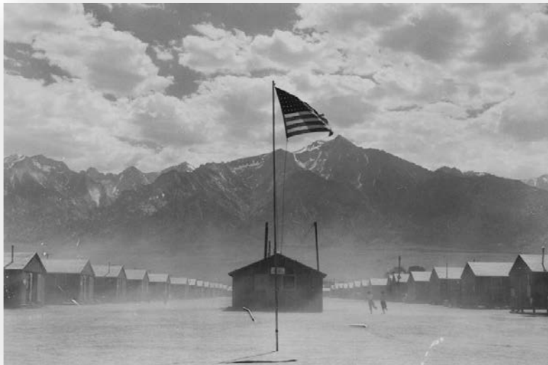
Primary Source: Photograph

ほとんどの日系アメリカ人は、政府への忠誠を示すために投獄を受け入れることを選択しましたが、抵抗する人もいました。フレッド・コレマツは日系アメリカ人であり、カリフォルニア州サン・リアンドロに留まることを決意し、故意に除外命令に違反した。彼は政府を訴え、大統領令 9066 は彼の修正第 5 条修正の権利を侵害するという点で違憲であると主張した。つまり、政府が彼を刑務所に入れたい場合、まず犯罪のために彼を裁判にかけなければならないだろうとコレ松は言った。明らかに、彼が間違ったことをしていたのは、日本人の家族に生まれたことだけであり、それは犯罪ではありませんでした。彼の事件であるコレマツ対アメリカ合衆国は、1944 年に最高裁判所によって最終的に決定され、抑留された日系アメリカ人が妨害行為またはスパイ行為の罪で発見されなかったにもかかわらず、彼は敗訴した。